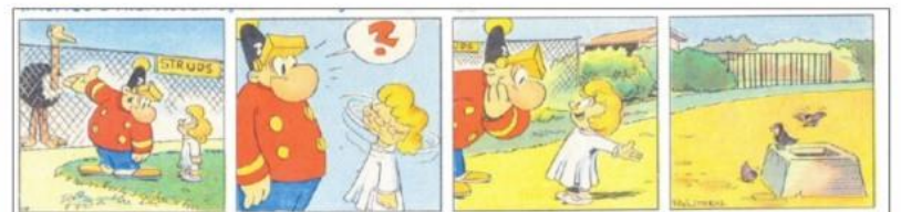
»Rasmus Dyrepasser« får klar besked om den zoologiske haves sande seværdigheder.