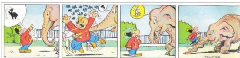
»Rasmus Dyrepasser« får løst et kildent problem.