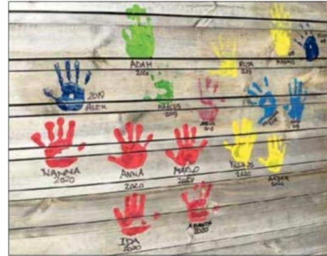
3-6 årige børn fra Tømmerup Fribørnehave sætter deres præg på Galleri Kordel i april.

sin historie som rebslagerbolig og sine fredede bygninger meget at byde på, når fantasien skal i spil. Det er oplagt at tage på eventyr i galleriet og finde alle de smukke og fantasifulde detaljer, som bygningerne rummer.