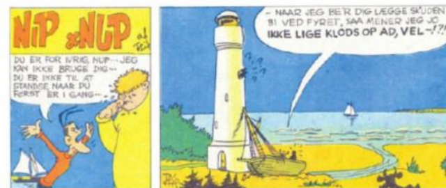
Den sidste Nip & Nup fra 1955.